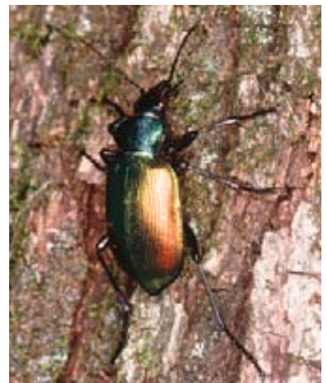
Fig. 13. Le carabide ( Calosoma sycophanta ) est un bon grimpeur qui poursuit les chenilles du bombyx disparate dans les arbres.

Alors que les douglas et surtout les mélèzes sont capables de reverdir, une seule attaque du bombyx peut être fatale à d'autres résineux.