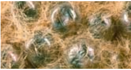
Fig. 5. Les chenilles entièrement développées hibernent dans le chorion de l'œuf, entourées d'un duvet de poils abdominaux.