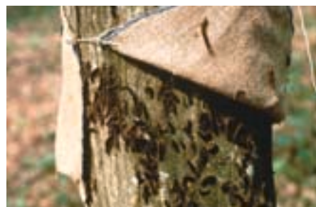
Fig. 17. Bande de capture ouverte.

Jusqu'à présent, les pullulations du bombyx disparate ont toujours pu être rapidement enrayerées de manière naturelle sous l'action conjointe de différents facteurs (encadré 3). Au Tessin, au début des années 90, les défoliations locales n'ont duré que 2 ou 3 ans. Des pullulations déclenchées par un temps chaud et sec se produisent régulièrement, mais en général la forêt les supporte facilement si elle n'est pas soumise à d'autres stress.