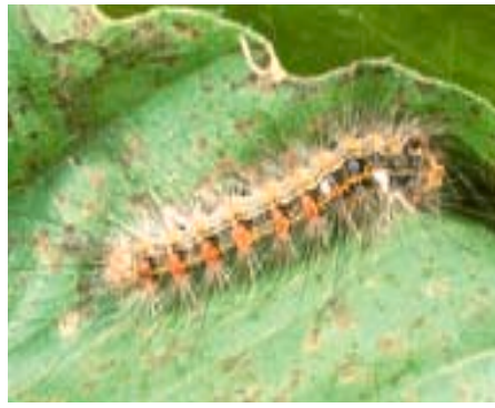
Fig. 11. Chenille du bombyx disparate plusieurs fois parasitée: ces œufs blancs ont été déposés par un tachinide ( Parasetigena silvestris ).