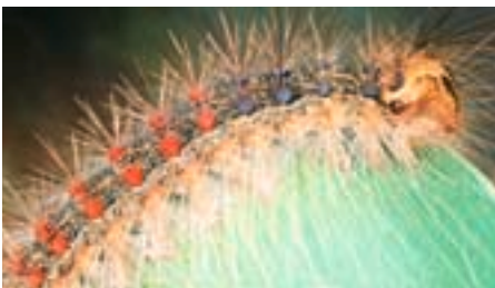
Fig. 7. Chenille entièrement développée portant des verrues aux couleurs typiques.

ture de ses poils abdominaux jaunâtres, ce qui donne à la ponte un aspect spongieux (fig. 4). Si les effectifs sont faibles, les œufs sont déposés sur le côté sud du tronc; pendant une gradation, ils sont sur l'arbre entier, sous l'écorce détachée d'arbres morts, sur des pierres et autres objets. Le nombre d'œufs – entre 100 et 1000 – dépend de l'offre en nourriture et de la phase