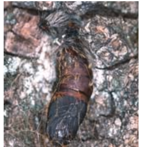
Fig. 8. Chrysalide fixée à un tronc.

Virus, bactéries et champignons en font partie (tabl. 2). Les virus polyédres, d'origine naturelle, provoquent une polyédrose mortelle, notamment chez les chenilles plus âgées et les chrysalides. En général, ces virus n'infectent qu'une espèce d'hôte contrairement aux nombreux types de bactéries qui