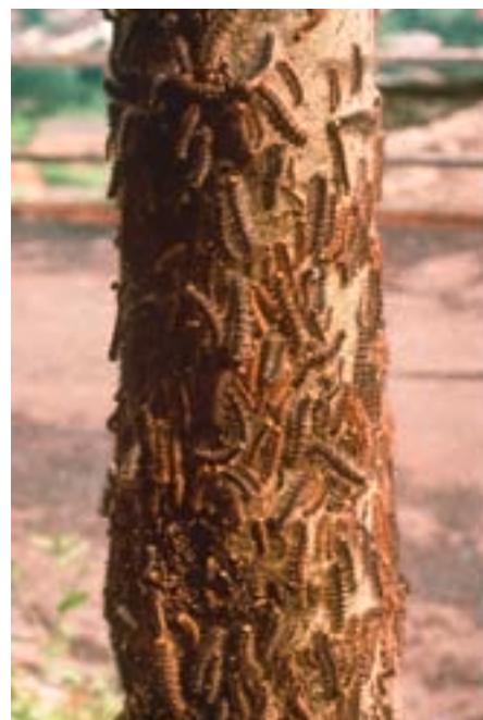
Fig. 16. A la recherche de nouvelles plantes nourricières, une masse de chenilles rampent le long des murs, des piquets et des troncs d'arbres.