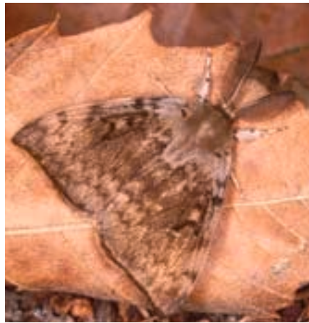
Fig. 3. Papillon mâle dans un rare moment de repos.