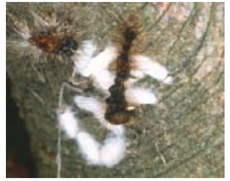
Fig. 12. Chenille du bombyx disparate tuée par les larves parasites du braconide Apanteles ; les cocons blancs des parasitoïdes sont à côté.

vent attaquées par d'autres espèces de carabides prédateurs inaptes à l'escalade, contrairement aux calosomes.