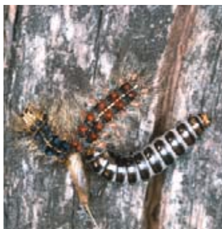
Fig. 14. Larve du calosome s'alimentant d'une chenille de bombyx disparate (en haut).

Outre les chenilles néonates déplacées par le vent, les femelles asiatiques (encadré 2) peuvent aussi contribuer à la propagation du bombyx disparate car cette race est apte au vol. Elle est aussi attirée par plus de plantes nourricières que les populations européennes. Ainsi, les chenilles du bombyx asiatique se développent nettement mieux que les européennes sur les tilleuls ( Tilia spp.), les pommiers ( Malus spp.), les mélèzes ( Larix spp.) et les pins sylvestres ( Pinus sylvestris ). D'après des recherches récentes sur les femelles du bombyx de diverses provenances (Asie, Sud de l'Europe, Provence, Bade-