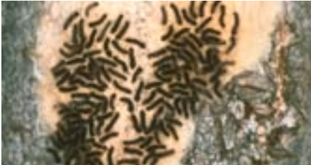
Fig. 6. Au sortir de l'œuf, les chenilles restent quelques jours sur les lieux de ponte, appelés «miroirs d'œufs».