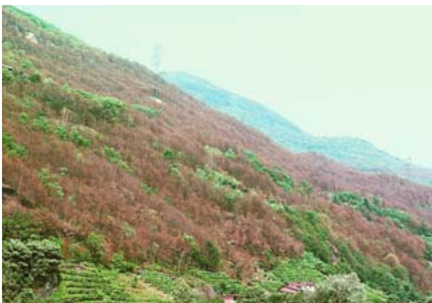
Fig. 2. Défoliations à large échelle dans une châtaigneraie du Tessin (Monte Carasso, 1992).