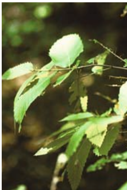
Fig. 15. Après avoir été défoliés, les châtaigniers produisent de nouvelles feuilles le même été.

En Suisse, l'Ordonnance fédérale sur les forêts de 1992 n'autorise l'utilisation de produits phytosanitaires en forêt que si la conservation du peuple-