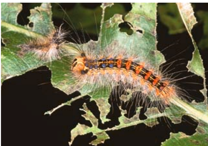
Fig. 1. Chenille du bombyx disparate.

Dagmar Nierhaus-Wunderwald et Beat Wermelinger