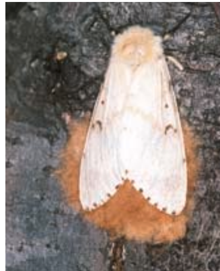
Fig. 4. Papillon femelle déposant ses œufs (ponte d'aspect spongieux, d'où le nom de la spongieuse).

les chenilles gaspillent énormément de nourriture (elles laissent tomber au sol des parties de feuilles rongées; fig. 9). Au cours de son développement, une chenille dévore un mètre carré de feuillage à peu près.