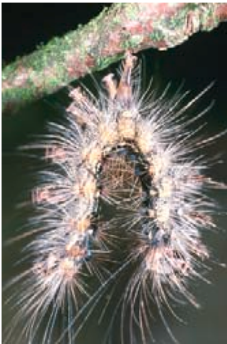
Fig. 10. Chenille tuée par le virus. Elle est suspendue dans la position d'un V inversé.

Les principaux prédateurs des chenilles et des chrysalides du bombyx disparate sont les larves et les insectes parfaits d'un carabide, le calosome sycophante ( Calosoma sycophanta ) (fig. 13, 14; tabl. 2). Ce coléoptère, très rare en période de latence, se multiplie largement et rapidement lorsque la nourriture est riche. Outre les tachinides, les carabides et les silphides sont des vecteurs potentiels de virus. Après avoir été véhiculées par le vent, les chenilles néonates échouées sur le sol forestier sont sou-